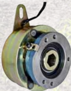
EDF-20F / EDF-40F